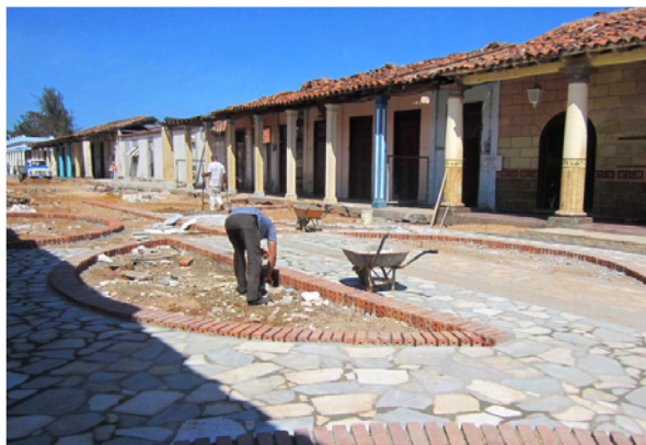
Renovering av affärsgata i centrum

Det är alltid kul att kika så vi traskade runt i staden och tittade på folk och byggnader. Lagom till lunch hittade vi en affärsgata som man höll på att färdigställa och med små nyöppnade affärer. Här fanns även en restaurang så vi klev in. Lite besvikna var vi över de små portionerna för när notan kom in var den på 63. Vi räknade upp 63 CUC (vi har betalat 60 CUC för en lunch för oss fyra tidigare) men då kom vår bordsgranne på fötter. Han viftade med massa pesos och vi trodde att han ville växla men nej, han ville bara hjälpa oss att betala rätt! Här betalar man nämligen med lokala pesos. Mannen var från den fransktalande delen av Kanada så kommunikationen haltade lite men till slut framkom att maten var i pesos medan drycken var i CUC. Notan åkte ut och landade slutligen på 150 pesos, totalt ca 50 SEK istället för de närmare 500 vi höll på att betala!