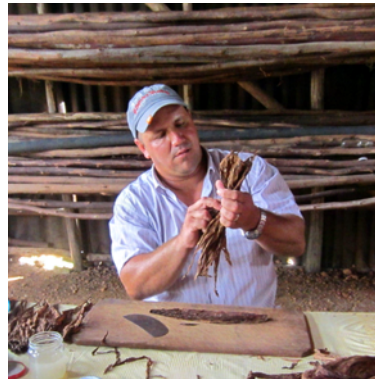
Blad från plantans alla delar ingår i varje cigarr