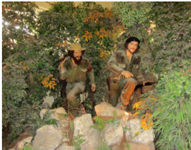
Staty av Camilo och Che Guevara

landet efter ett par år. Då hade Castro lierat sig med Sovjet och 1965 bytte det socialistiska partiet namn och blev officiellt kommunister. Där någonstans gick det nog snett för historiskt sett har kommunismen aldrig kunnat överleva. Att USA skapade ett totalt embargo, och fortfarande håller fast vid det, är däremot svårt att förstå.