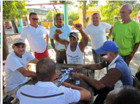
Dominospel på torget

Det är alltid kul att kika så vi traskade runt i staden och tittade på folk och byggnader. Lagom till lunch hittade vi en affärsgata som man höll på att färdigställa och med små nyöppnade affärer. Här fanns även en restaurang så vi klev in. Lite besvikna var vi över de små portionerna för när notan kom in var den på 63. Vi räknade upp 63 CUC (vi har betalat 60 CUC för en lunch för oss fyra tidigare) men då kom vår bordsgranne på fötter. Han viftade med massa pesos och vi trodde att han ville växla men nej, han ville bara hjälpa oss att betala rätt! Här betalar man nämligen med lokala pesos. Mannen var från den fransktalande delen av Kanada så kommunikationen haltade lite men till slut framkom att maten var i pesos medan drycken var i CUC. Notan åkte ut och landade slutligen på 150 pesos, totalt ca 50 SEK istället för de närmare 500 vi höll på att betala!