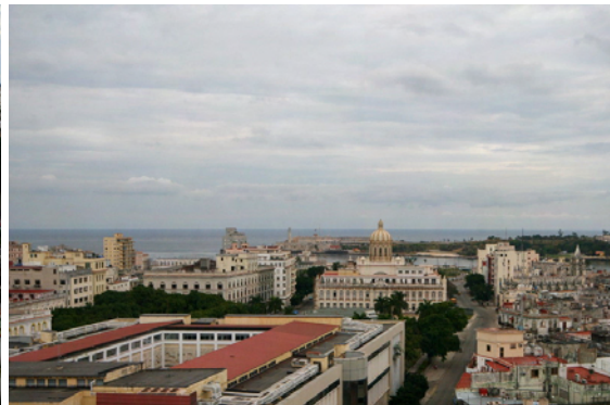
Utsikt över gamla Havanna, slitet och förfallet men också renoverat och praktfullt