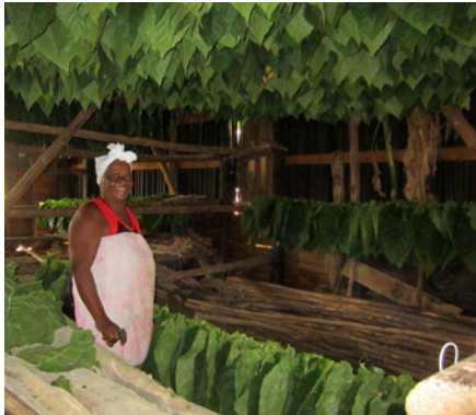
Tobaksbladen hängs upp på tork

Vår värd rullade en cigarr för oss och beskrev då de olika bladens användning i varje cigarr.