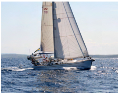
Flying Penguin längs Kubas kust

Teorin gick ut på att om ström och vatten gick åt samma håll plattades vattnet ut. Så innan en ny nordvind, mitt på dagen i lätta sydvästliga vindar kunde vi passera med bara 0,5-1,5 knops motström på ett snällt hav.