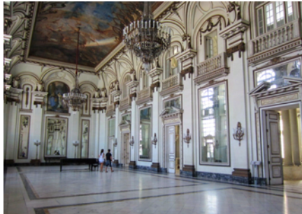
En av salarna i palatset