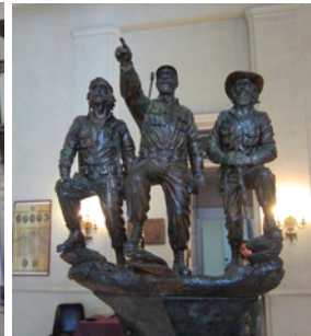
De tre: Che, Fidel & Camilo

Lättnader har skett i Kuba under den sista tiden så förhoppningsvis kommer det att ske stora förändringar inom bara några få år. Av Kubas befolkning på ca 12 miljoner är hälften under 20 år, sjuk- och hälsovård är väl utvecklad och utbildningsnivån hög. De vi träffar pratar oftast engelska, mer eller mindre, och den som vill kan studera språk. Det borde skapa förutsättningar för Kubas unga den dagen som man börjar leva som resten av världen.