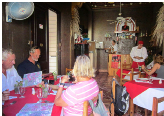
Las Clavellinas med sina 4 bord