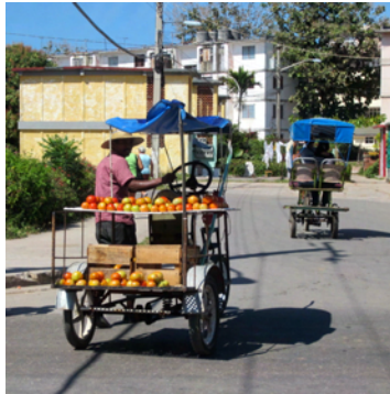
En av många grönsakshandlare