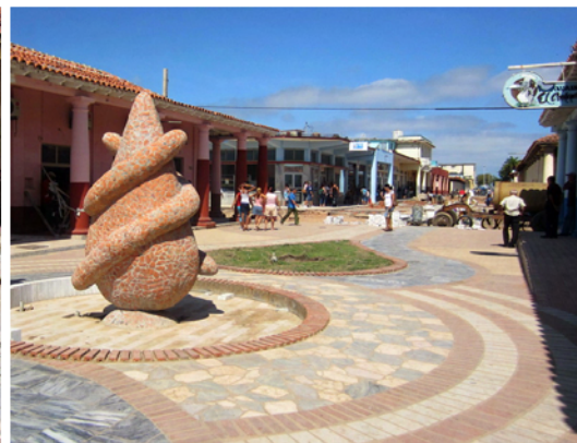
Så här fint blir det!