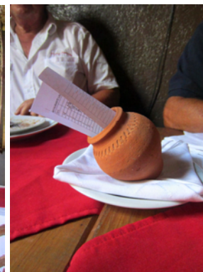
Notan kom i sött krus

Till kvällen blev det taxi hem i en bullig Chevrolet från tidigt 1950-tal. Bekväma säten och en duktig chaufför i en bil vars instrumentering slutat fungera för många år sedan och det var tveksamt om det fanns mer än två växlar.