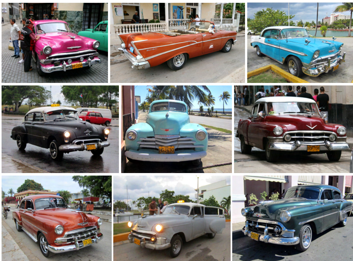
Ett axplock av gamla bilar som rullar på Kubas gator