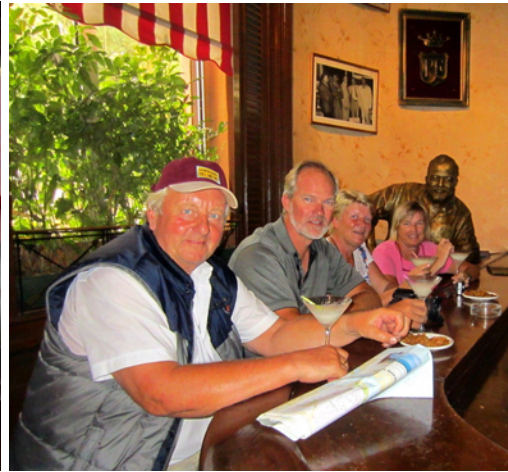
I Hemingways fotspår: Mohito & cigarr på La Bodeguita och daiquiri på El Floridita

Det finns hur mycket som helst att se men denna första dag nöjde vi oss med att insupa atmosfären och känna på stämningen. Ett besök i Bacardi Tower (familjen Bacardi var en gång stora här) gav fin överblick över staden. El Capitolio, en exakt kopia av Capitolium i Washington, gågatan Calle Obispo som kantas av butiker, hantverksstånd och artister, Plaza de Armas som är stadens äldsta torg och en titt på El Castillo de la Real Fuerza, Amerikas näst äldsta fästning, byggd 1577, helt intakt med vallgravar och allt.