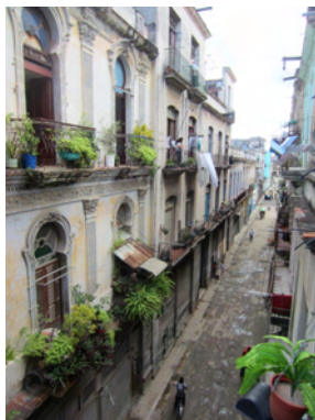
Utsikt från restaurangen