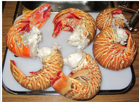
Och vi fick bli köpa 6 fina hummerstjärtar

Vi bunkrade ordentligt innan vi lämnade USA och här på Kuba har vi vid ett par tillfällen kunnat fylla på med frukt och grönsaker. En gång lyckades vi köpa lite kyckling så dessa tillskott av hummer och fisk är lycka för oss. Vårt färskt kött är förstås slut men ombord på Flying Penguin finns frys så ännu grillas det då och då. Var kubanen handlar har vi inte lyckats räkna ut men varje kuban får en tilldelning varje månad av basvaror, till och med rom, vilket de hämtar någonstans. Vad vi förstår kompletteras detta sedan med frukt och grönt och resten anses vara lyxvaror. Inkomsten för en industriarbetare är 12 CUC per månad men då skall man komma ihåg att detta är en form av fickpengar då man redan har bostad, kläder och basmat.