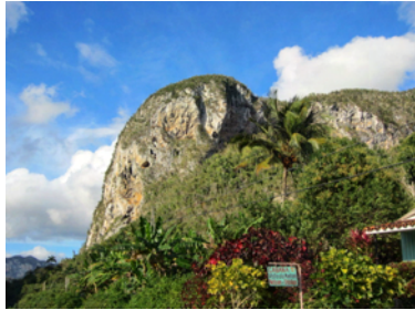
Läckra klippor i Viñjalesdalen.