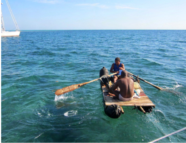
På hemmabyggt flotte

På morgonen kom ett par grabbar ut i en hemmabyggt båt bestående av flytkorvar och därpå ett lappverk av vad man hittat. På väg mot oss dök de och plockade upp humrar som vi sedan kunde köpa för några få CUC. Snacka om pinfärskt!