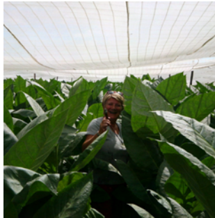
På besök bland tobaksplantor

Vi fick sedan besöka plantorna, som odlas både fritt och under plasttak från november till januari och skördas februari till maj. Allt sker manuellt, här odlade man ca 150 000 plantor per år. Bladen plockas förstås för hand, nerifrån och upp på plantan, tre blad var femte dag. Sen träs de upp på trådar och hängs upp på tork i 6-24 månader beroende på kvalitet. Endast kvinnor arbetar med att trä upp bladen på grund av sina små och smidiga händer. Man separerar bladen från plantans nederdel, mittendel och topp. Varje cigarr innehåller så småningom blad från samtliga delar av plantan.