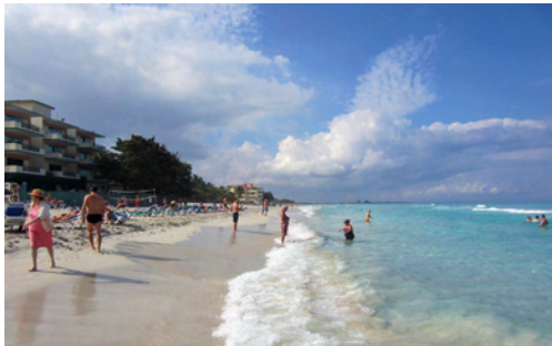
Strandliv i Varadero

Nu hade det blivit sen eftermiddag så vi körde vidare till turistorten Varadero och tog in på ett hotell. Här får man betala en liten avgift i vägtullen för att köra ut. Hit kommer många Kubaresenärer och här finns härliga sandstränder, hantverksmarknader och allt ser lite fräschare ut. För ca 850 SEK fick vi ett rum och då ingick frukost och lunch. Till kvällen upptäckte vi att drinkar i baren ingick också! Det var verkligen "all inclusive".