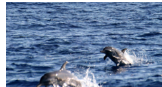
Söta små lekfulla delfiner på besök

Vi gjorde tvärtom. Teorin gick ut på att om ström och vatten gick åt samma håll plattades vattnet ut. Så innan en ny nordvind, mitt på dagen i lätta sydvästliga vindar kunde vi passera med bara 0,5-1,5 knops motström på ett snällt hav.