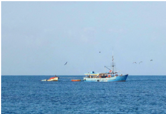
En fiskebåt ankrade vid skymningen

Från Cayo Largo följde vi revet österut och kunde till kvällen ankra bakom revöarna Cayos de Dios. Efter en stund kom en fiskebåt och ankrade bredvid oss och strax kom en kille roendes för att fråga om vi ville ha fisk och lobster. Kaptenen på fiskebåten fyllde år så pengar var inte intressant men kanske något att dricka och tvål om vi hade. För 6 hummerstjärtar (2,4 kg) och 2 red snappers (2,5 kg) betalade vi med fyra små reseförpackningar av tvål och schampo, totalt värt 4 US-dollar. Som bonus fick han två öl också. Flying Penguin gjorde samma inköp men betalade en liten flaska rom och ett par öl. Totalt gav vi ca 45 SEK per båt för våra inköp och alla var glada och nöjda med affären.